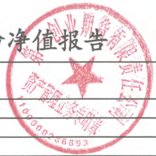
睿赢1号净值 (单位: 元)